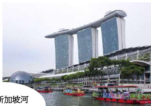
夜游新加坡河 River Cruise