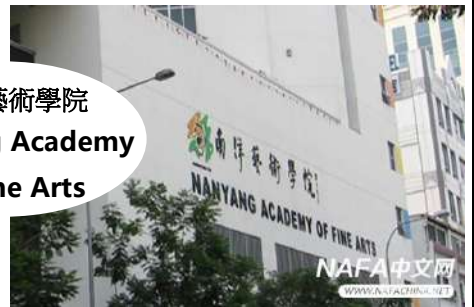
南洋藝術學院 Nanyang Academy of Fine Arts