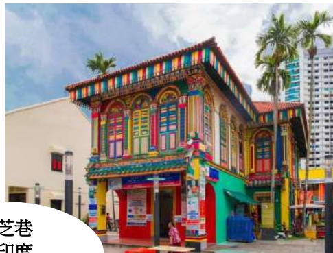
哈芝巷 小印度 甘榜格南