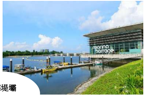
濱海堤壩 Marina Barrage