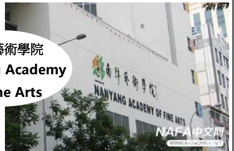
南洋藝術學院 Nanyang Academy of Fine Arts