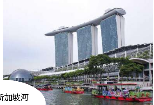
夜游新加坡河 River Cruise